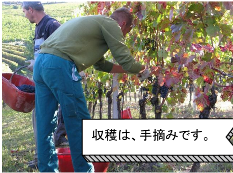
収穫は、手摘みです。

■生産者: アドリア・ヴィーニ ADRIA VINI ... 2003年設立のワイン製造会社。ピエモンテに本社を構えるAraldica Vini Piemontesi社と英国のワイン商社BOUTINOT社による共同経営で運営されています。アドリア・ヴィーニのコンセプトは、長いワイン造りの歴史と世界でも有数の生産量を誇るワイン大国イタリアから、地方性豊かな個性ある美味しいワインを世界へ流通させることです。製造体制、品質管理は徹底されており、低価格ながらも高品質なワインを市場へ提供しています。